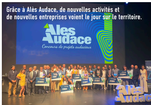
Grâce à Alès Audace, de nouvelles activités et de nouvelles entreprises voient le jour sur le territoire.