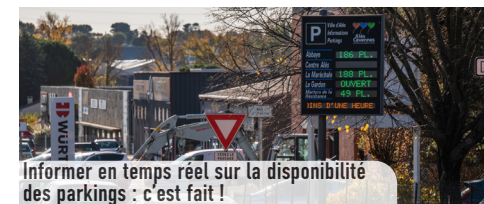
Informez en temps réel sur la disponibilité des parkings : c'est fait !