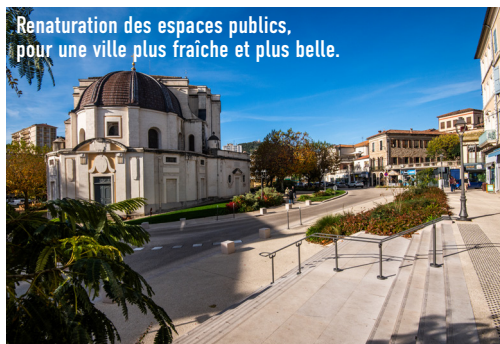
Renaturation des espaces publics, pour une ville plus fraîche et plus belle.