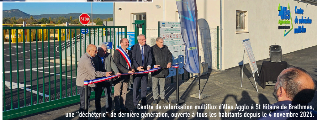
Centre de valorisation multiflux d'Alès Agglo à St Hilaire de Brethmas, une “déchèterie” de dernière génération, ouverte à tous les habitants depuis le 4 novembre 2025.