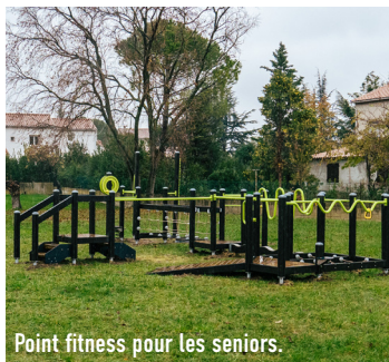
Point fitness pour les seniors.