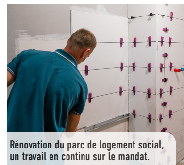
Rénovation du parc de logement social, un travail en continu sur le mandat.