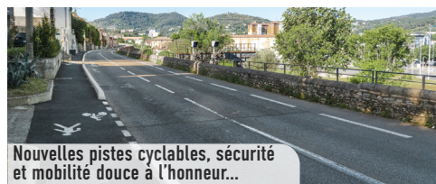
Nouvelles pistes cyclables, sécurité et mobilité douce à l'honneur...