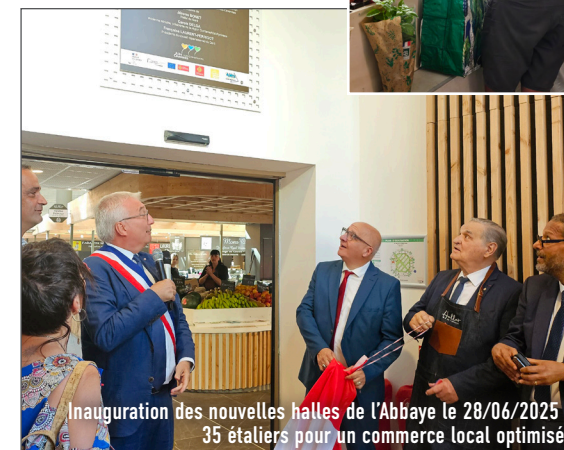
Inauguration des nouvelles halles de l'Abbaye le 28/06/2025 : 35 étaliers pour un commerce local optimisé.