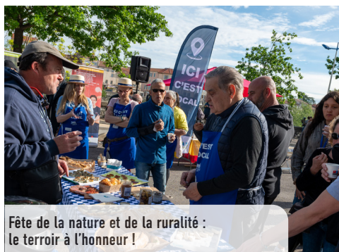
Fête de la nature et de la ruralité : le terroir à l'honneur !