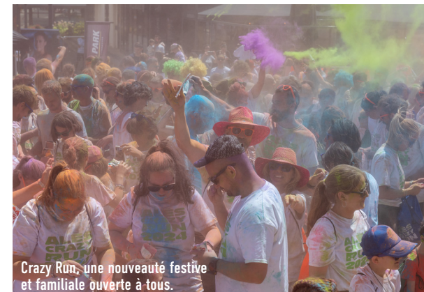
Crazy Run, une nouveauté festive et familiale ouverte à tous.