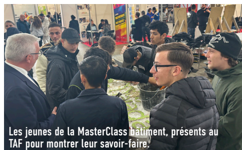
Les jeunes de la MasterClass bâtiment, présents au TAF pour montrer leur savoir-faire.