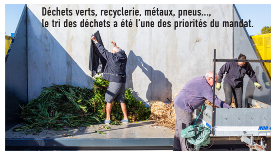
Déchets verts, recyclerie, métaux, pneus... le tri des déchets a été l'une des priorités du mandat.