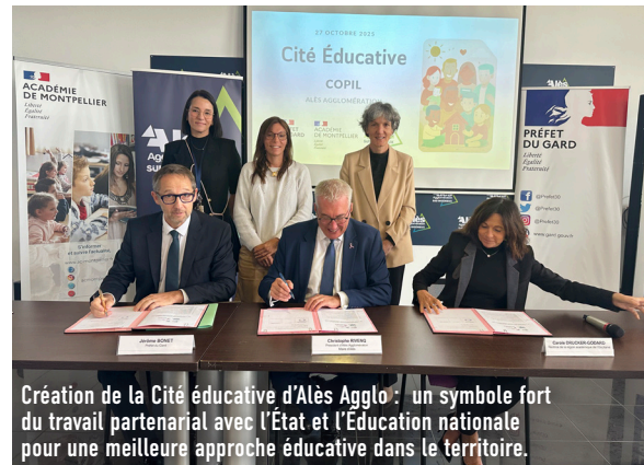
Création de la Cité éducative d'Alès Agglo : un symbole fort du travail partenarial avec l'État et l'Éducation nationale pour une meilleure approche éducative dans le territoire.