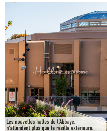
Les nouvelles halles de l'Abbaye, n'attendent plus que la résille extérieure.