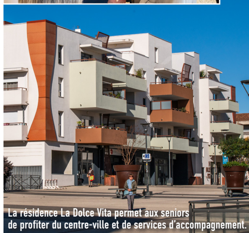
La résidence La Dolce Vita permet aux seniors de profiter du centre-ville et de services d'accompagnement.