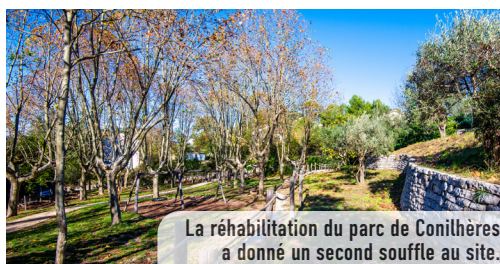
La réhabilitation du parc de Conilhères a donné un second souffle au site.