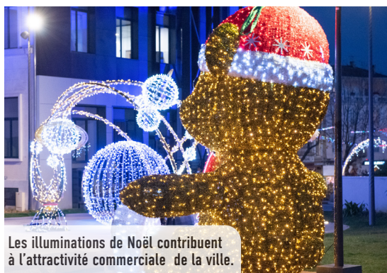
Les illuminations de Noël contribuent à l'attractivité commerciale de la ville.