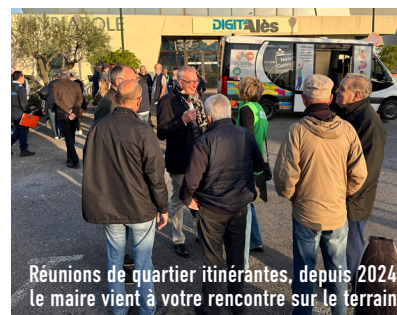
Réunions de quartier itinérantes, depuis 2024, le maire vient à votre rencontre sur le terrain.