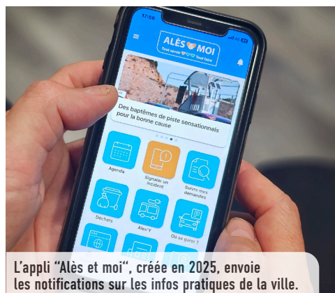
L'appli "Alès et moi", créée en 2025, envoie les notifications sur les infos pratiques de la ville.