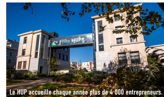
Le HUP accueille chaque année plus de 4 000 entrepreneurs.