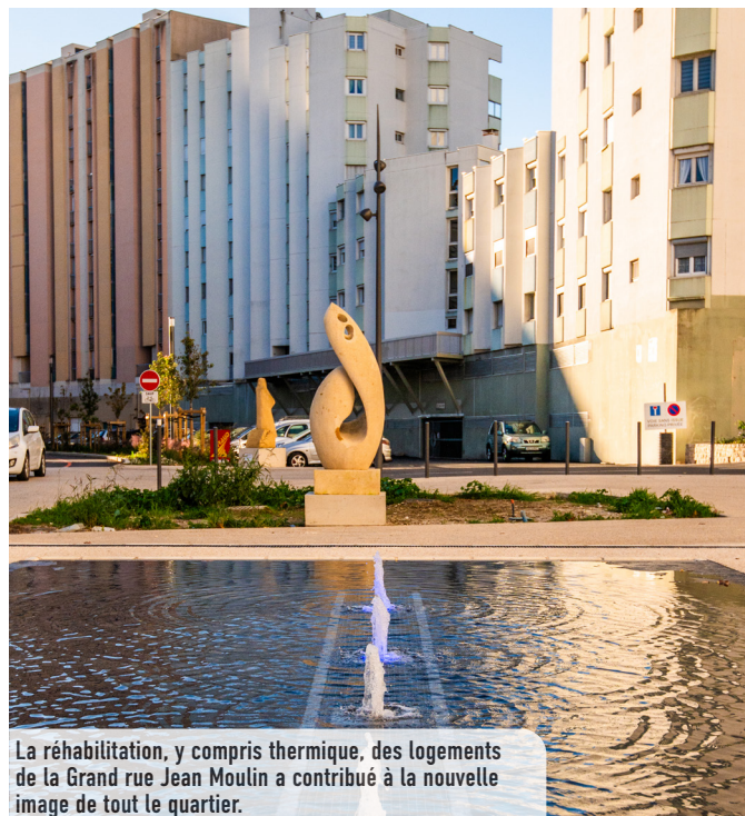
La réhabilitation, y compris thermique, des logements de la Grand rue Jean Moulin a contribué à la nouvelle image de tout le quartier.