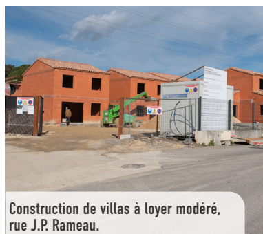
Construction de villas à loyer modéré, rue J.P. Rameau.