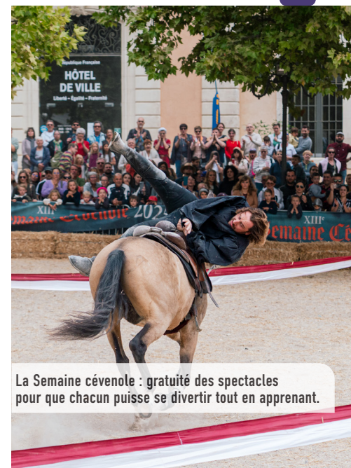
La Semaine cévenole : gratuité des spectacles pour que chacun puisse se divertir tout en apprenant.