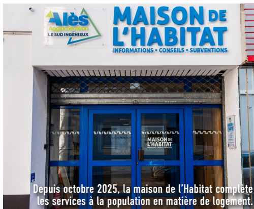
Depuis octobre 2025, la maison de l'Habitat complète les services à la population en matière de logement.