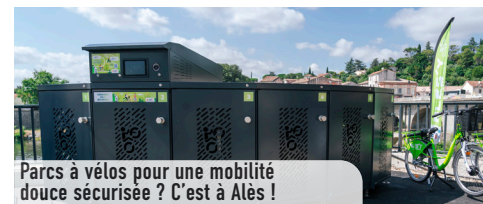
Parcs à vélos pour une mobilité douce sécurisée ? C'est à Alès !