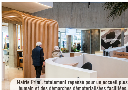
Mairie Prim', totalement repensé pour un accueil plus humain et des démarches dématérialisées facilitées.